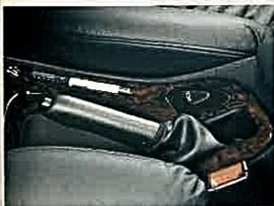
En el Ford todo está a mano. La suspensión dinámica se controla con un botón.