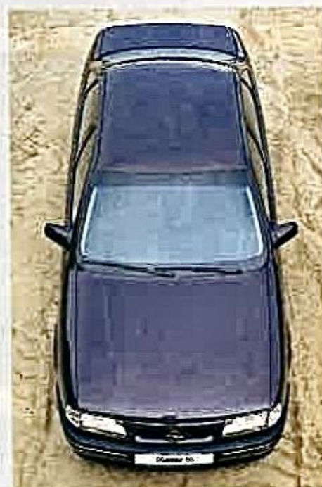
La carrocería del Vectra tiene seis años a sus espaldas, sin embargo es la que cuenta con la mejor habitabilidad.