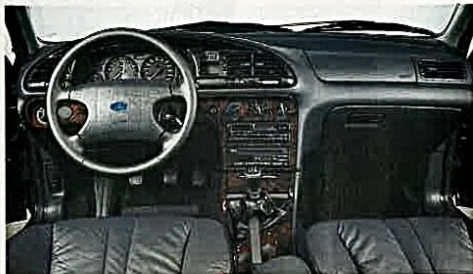
Con la gama 95 las versiones Ghia, y con mayor razón este alto de gama, se beneficia de un acabado más lujoso. El doble airbag es de serie y el volante, regulable.