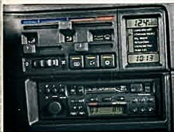
El sistema de dirección de Opel es muy eficaz. El aire acondicionado es de serie.