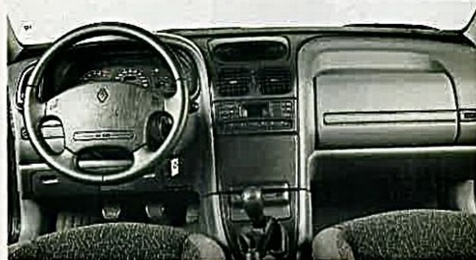
Es el más barato, pero a costa de ofrecer una presentación y un equipamiento muy pobres. El airbag del lado derecho no se ofrece ni en opción. El acabado es bueno.

modelos que no superan los cuatro millones de pesetas. El caso más reciente lo encontramos en la marca Ford, que ha tardado seis años y ha invertido 650 millones de dólares en desarrollar su nuevo motor V6 de 170 caballos para el Mondeo.