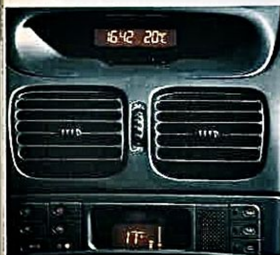
El aire acondicionado del Laguna se ofrece como opción. Cuesta 189.000 pesetas.

también ofrecen sorpresas a poca velocidad. Cualquiera de los tres (el Vectra peor por lo anteriormente comentado), es capaz de circular por ciudad en quinta y a 45 kilómetros por hora sin decir esta boca es mía.