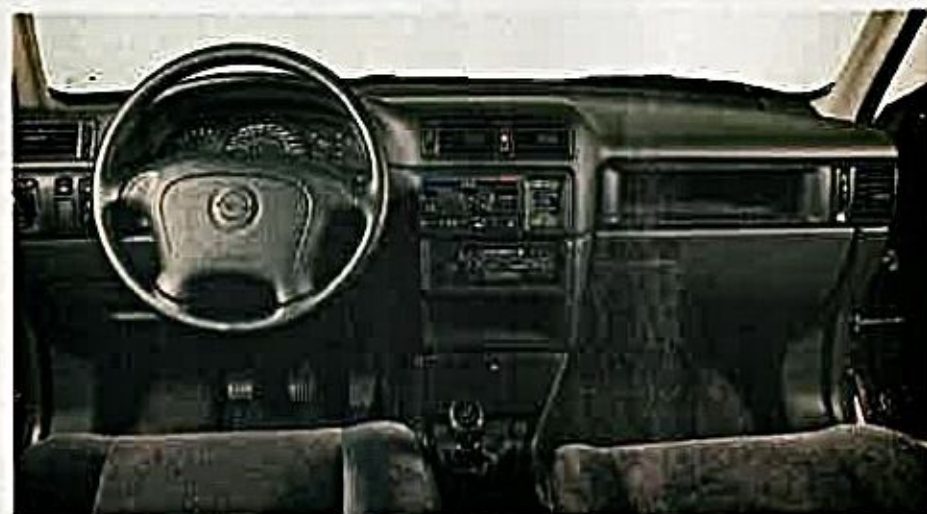
En algunos aspectos se ve el paso del tiempo. Los mandos de los elevavidrios están lejos del volante, la presentación es un tanto pobre, pero el doble airbag de serie.